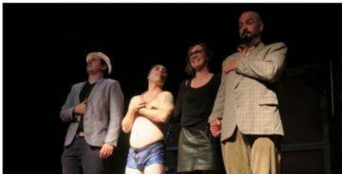
Les spectateurs ont pu partager l'aventure du Brelan d'Ane.

Réservations au 06 63 11 60 50 ou contact@improandco.fr ou au magasin "Sale Karactère", rue Marchande.