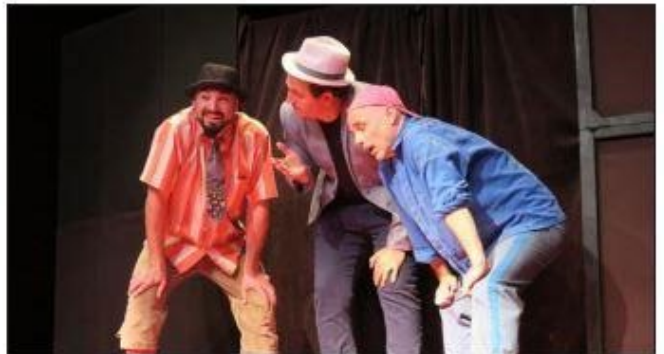
Gags et quiproquos à volonté.