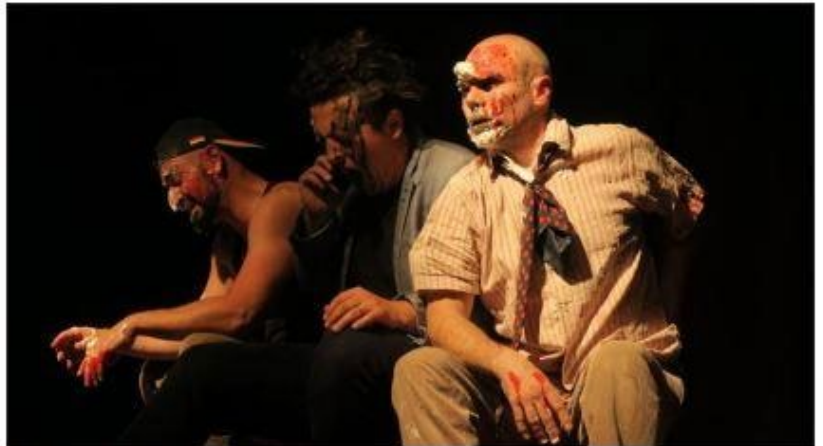
Trois comédiens talentueux.

Le prochain rendez-vous d'Impro & Co est fixé à ce samedi 11 mai avec les matches d'improvisations qui opposeront les acteurs locaux à leurs homologues